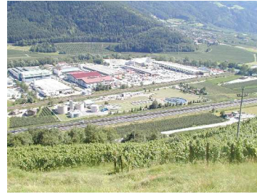
Immagine dell'impianto di depurazione