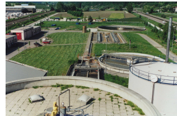
Immagine dell'impianto di depurazione