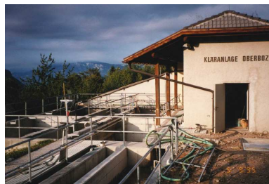
Immagine dell'impianto di depurazione