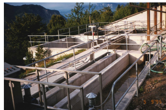
Immagine dell'impianto di depurazione